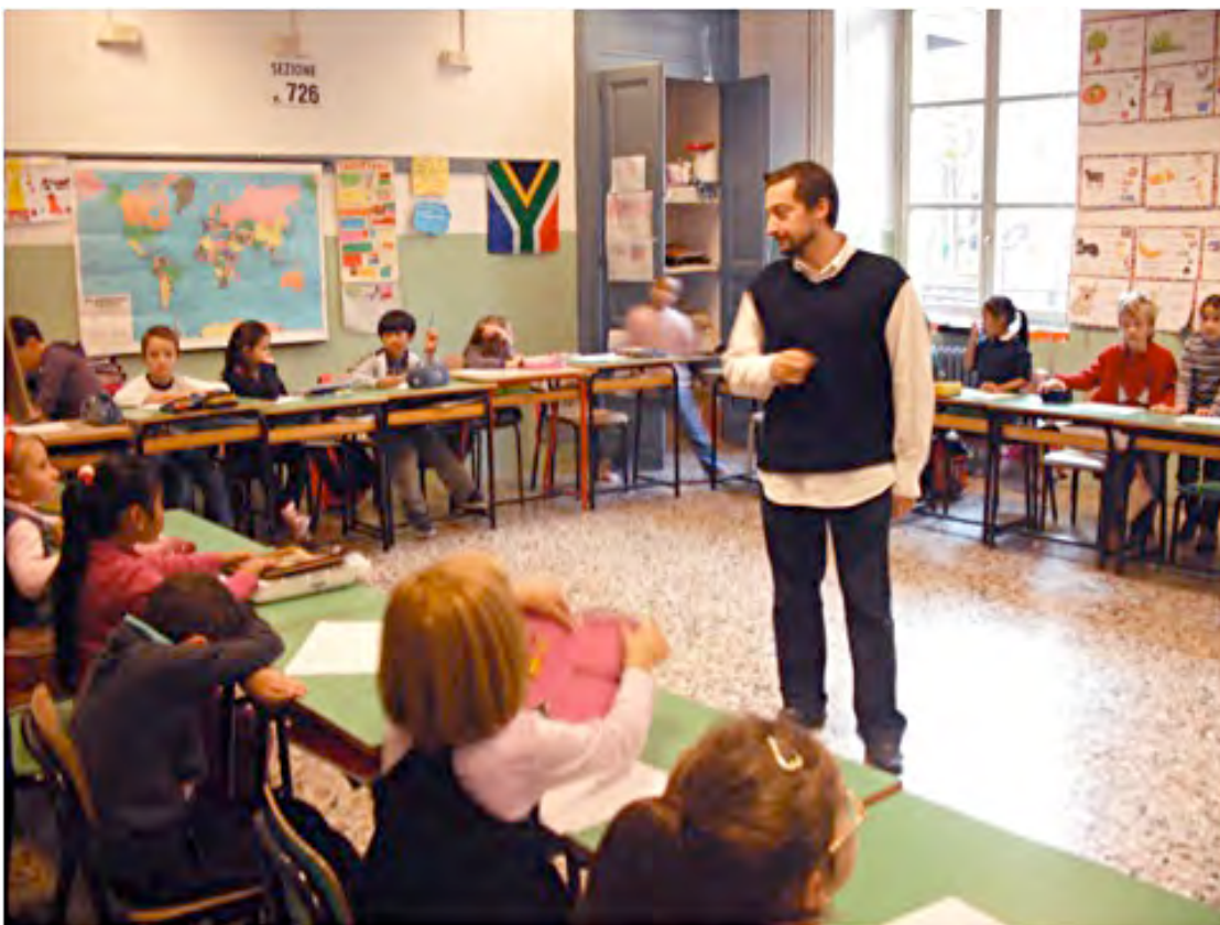
En almindelig skoledag i en italiensk første klasse.

hun fået en masse ud af udvekslingen, hvor to af lærerne fra Torino også har besøgt skolen i Lemvig.