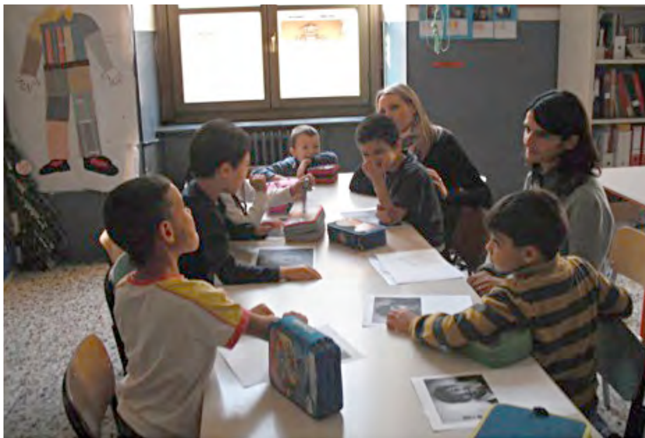
På besøg i det tosprogede tilbud på skolen i Italien. Timerne foregår om eftermiddagen efter skoletid.

Men selvom der er en verden til forskel på undervisningsformen i Italien og Danmark, har