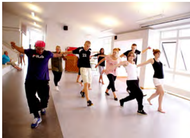
Unge fra Danmark, Letland, Norge, Finland og Island øver sig på breakdance.