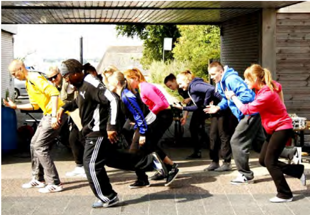
Cirkus-gruppen øver sig på Stubbe- købing Skole.

”Noget af det helt specielle ved VIBES 2012 var, at det blev så stor en succes, at lokalmiljøet i Stubbekøbing efterfølgende besluttede at lave deres eget projekt i 2013, så de også i fremtiden kan tilbyde de lokale unge den læring og udvikling, som et kulturmøde giver,” siger Bo Otterstrøm.