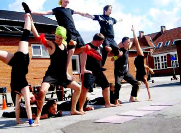
Resultatet fra cirkus-workshoppen bliver fremvist for publikum på Lilletorv i Nykøbing Falster.