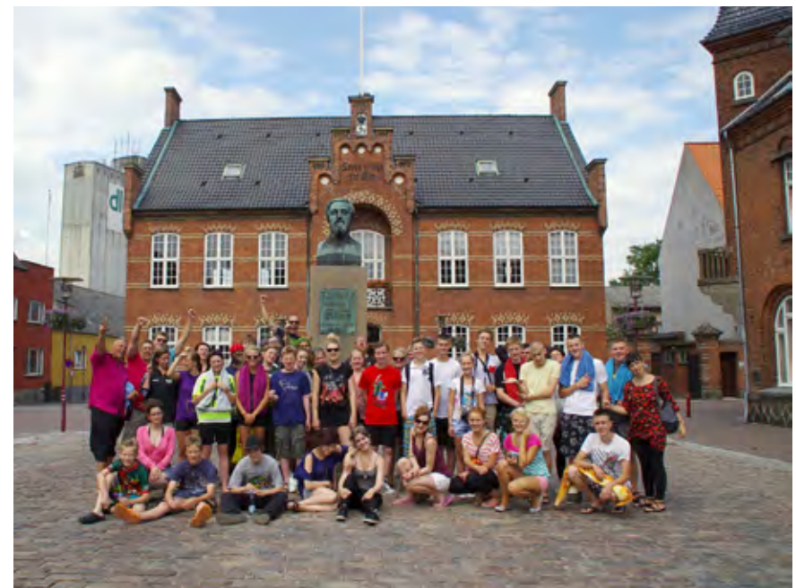
Alle deltagere fra VIBES 2012 foran Stubbekøbing Rådhus