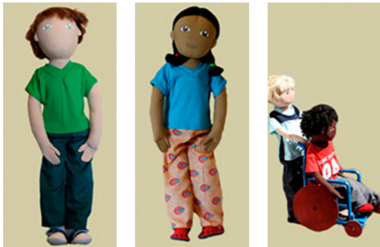
Eksempler på dukker.