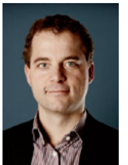
Morten Østergaard Uddannelsesminister

Jeg håber, at de studerende vil tage godt imod idékataloget og lade sig inspirere til at arbejde målrettet med formidling af de demokratiske værdier, som kendetegner et samfund med plads til alle. Det pædagogiske arbejde er et afgørende middel for at få børn og unge til at fravælge anti-demokratiske grupper og synspunkter og i stedet bidrage positivt og konstruktivt til fællesskabet.