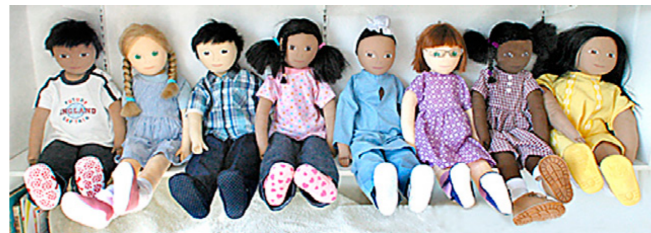
Eksempler på dukker.