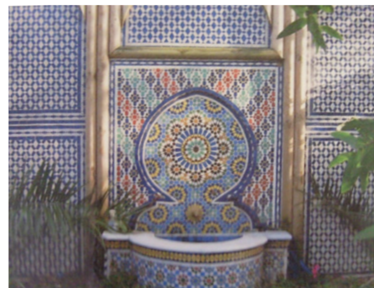
Foto fra marrokansk have i et lokalområde i London. Den marrokanske have er et af de religiøse steder, som daginstitutioner i lokalområdet besøger.